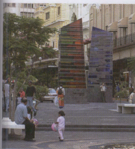
Plaza Neruda en Guadalajara

Se trata de dos piezas verticales cubiertas de cristales de diferentes colores con fragmentos de poemas inscritos en la superficie, que celebran el centenario del nacimiento del poeta. •