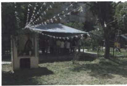
Situación precaria y desestructurada de los espacios públicos previos a la intervención.

arquitectos architects Rozana Montiel, Alin V. Wallach colaboradores assistants Cecilia Brañas, Diana León, Valery Michalon, Luis Galán cliente client INFONAVIT ubicación location of the building Unidad Habitacional San Pablo Xalpa, Delegación Azcapotzalco, Ciudad de México, México superficie construida total area in square meters 5.000 m 2 fecha finalización completion 2015