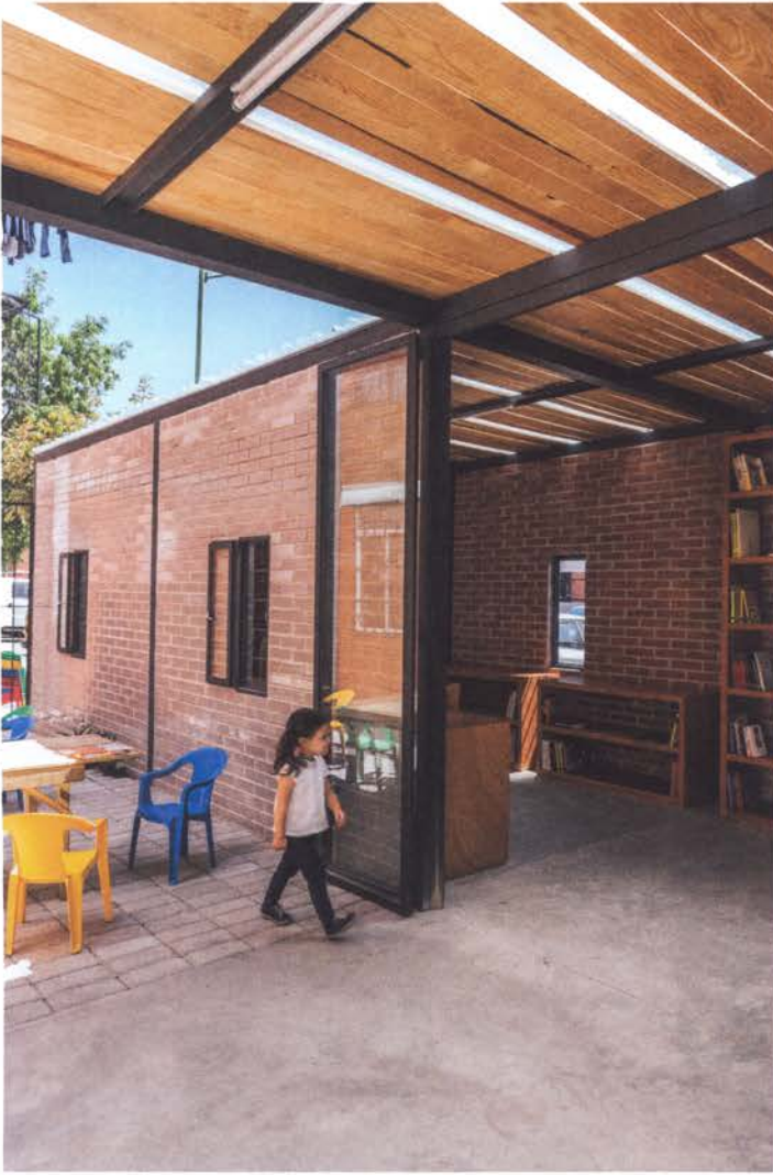
Pequeña biblioteca comunitaria sustituyendo un antiguo cobertizo de autoconstrucción.